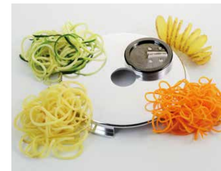
Gemüse Spaghettischneider (SP) • Vegetales en corte de espagueti (SP)