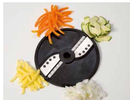
Juliennes (S) • Julianas (S)