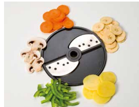
Grobschnitt (G) • Corte grueso (G)