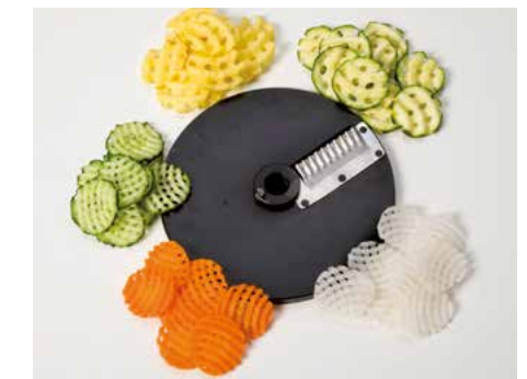
Gaufrettes (PG) • Mallas (PG)