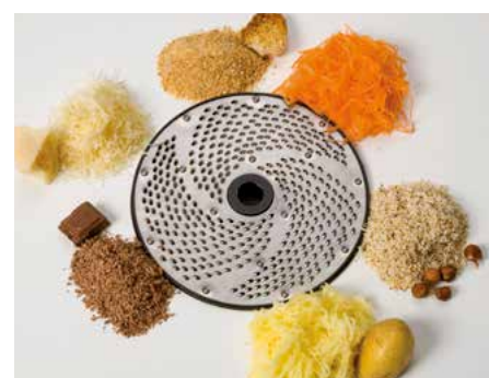
Universalsreibe • Rallador universal