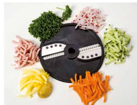
Allumettes (PA) • Fosforitos (PA)