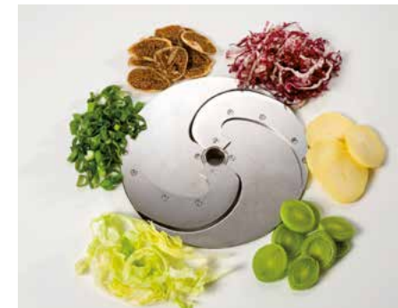
Sichelmesser (SM) • Hoja curva (SM)