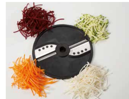
Juliennes (S) • Julianas (S)