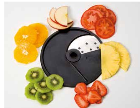
Tomate (TO) • Rebanadas de Tomate (TO)