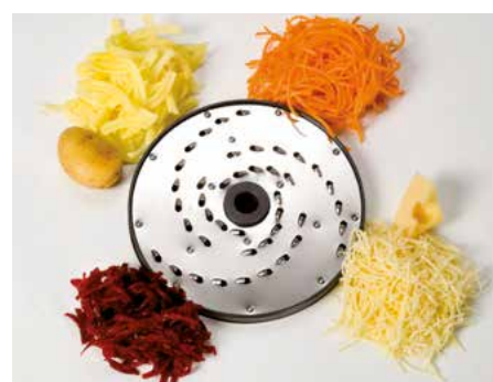
Raffelscheibe (RS) • Disco rallador (RS)