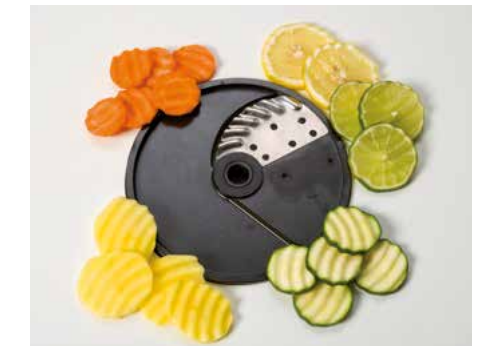
Demidov (SU) • Corte ondulado (SU)