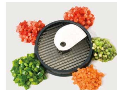
Würfel (W) • Cubos (W)