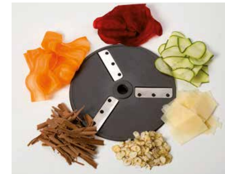
Hobelschnitt (HS) • Corte ultrafino (HS)