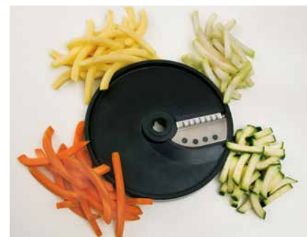
Bâtonnets (BT) • Bastones (BT)