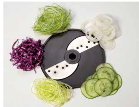
Feinschnitt (F) • Corte fino (F)