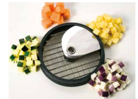
Würfel (W) • Cubos (W)