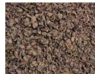
Tambor de polvo